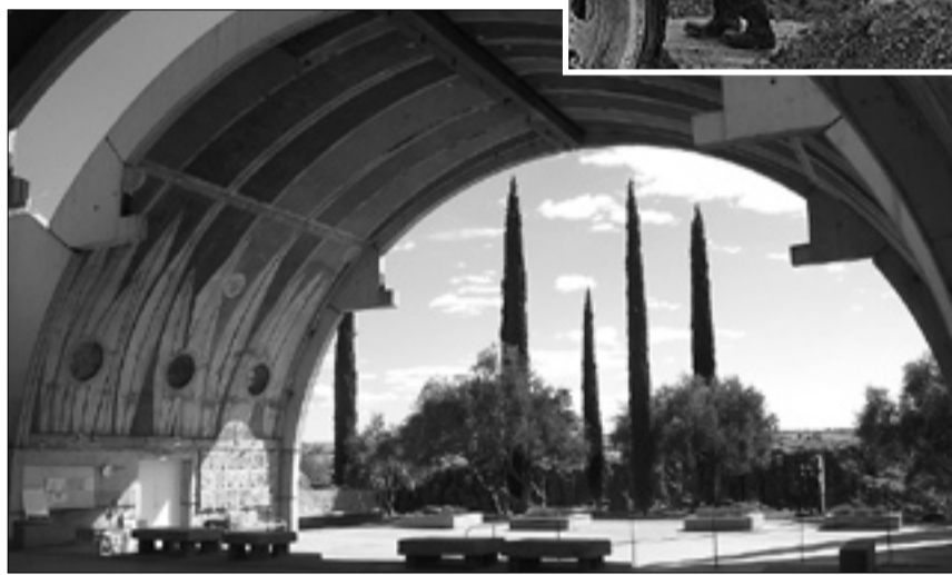
La volta sud. In alto, i lavori di realizzazione della rampa disabili vicino al Crafts III e un gruppo di workshopers con Soleri nel mese di agosto scorso